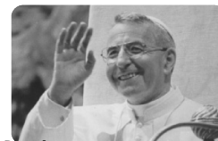
Beato Giovanni Paolo I, papa

Foglio settimanale parrocchie VAL BIOIS SAN GIOVANNI BATTISTA ~ CANALE SAN SIMONE APOSTOLO ~ VALLADA MADONNA DELLA SALUTE ~ CAVIOLA SAN SEBASTIANO MARTIRE ~ FALCADE