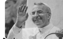
Beato Giovanni Paolo I, papa

Abitazione e ufficio parrocchiale: 0437 590280 Don Vito personale: 339 67 35 920 Museo Albino Luciani: 0437 19 48 001