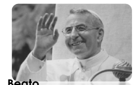
Beato Giovanni Paolo I, papa

Foglio settimanale parrocchie VAL BIOIS SAN GIOVANNI BATTISTA ~ CANALE SAN SIMONE APOSTOLO ~ VALLADA MADONNA DELLA SALUTE ~ CAVIOLA SAN SEBASTIANO MARTIRE ~ FALCADE