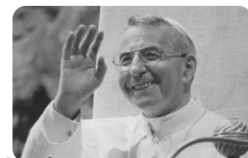
Beato Giovanni Paolo I, papa

Foglio settimanale parrocchie VAL BIOIS SAN GIOVANNI BATTISTA ~ CANALE SAN SIMONE APOSTOLO ~ VALLADA MADONNA DELLA SALUTE ~ CAVIOLA SAN SEBASTIANO MARTIRE ~ FALCADE