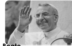
Beato Giovanni Paolo I, papa

Abitazione e ufficio parrocchiale: 0437 590280 Don Vito personale: 339 67 35 920 Museo Albino Luciani: 0437 19 48 001