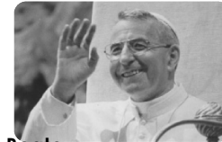
Beato Giovanni Paolo I, papa

Abitazione e ufficio parrocchiale: 0437 590280 Don Vito personale: 339 67 35 920 Museo Albino Luciani: 0437 19 48 001