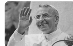
Beato Giovanni Paolo I, papa